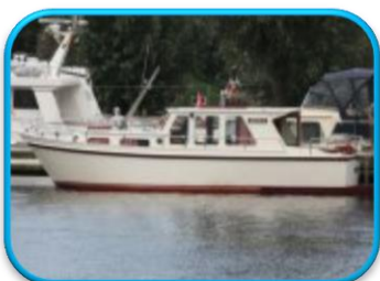
Swancreek 1050 OK.

Ook de "bijzondere hydraulische stuurinrichting" maakte rare geluiden. En de homokineet achter de koppeling was van eigen fabrikaat met garantie tot om de hoek. Het geheel was bijna niet te veranderen/repareren zonder de halve boot te slopen. Het geheel was voor ons daarom niet acceptabel en ook verder van de koop afgezien. Hebben we ook geen goed gevoel aan overgehouden, mede door de houding van de makelaar !