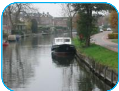
Bij de brug in Breukelen

De boot in ontvangst genomen bij de "Fa. Wolfrat " in Loosdrecht en na wat spullen te hebben ingeladen, naar Vianen gevaren. Ik had de vorige dag al de nodige bruggen en de Meindense sluis besteld. De sluisbediening was keurig op tijd aanwezig. Na 1x bellen voor de brug in Breukelen werd deze daarna heel vlot bediend. Ook de 2 bruggen in Maarssen gingen goed en vlug. De Beatrixsluis in Nieuwegein stond open en we konden gelijk invaren. Dit gold ook voor de sluis in Vianen . Al met al stonden we in 4,5 uur tijd bij ons voor de deur op de steiger van de passantenhaven. Totaal 45 km gevaren in 4,5 uur, waarvan 4 motoruren. Op het A.R.K. het motortje even flink 'opgestookt'. Ging allemaal goed en gaf geen problemen.