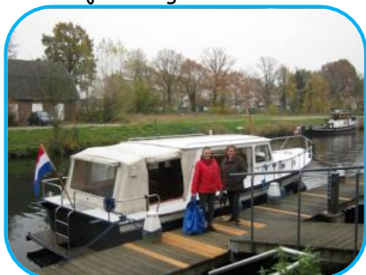
Passantenhaven Vianen bij ons huis